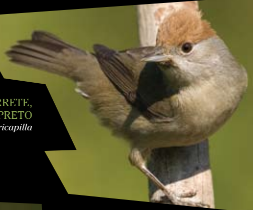
TOUTINEGRA-DE-BARRETE, TOUTINEGRA-DE-BARRETE-PRETO Sylvia atricapilla