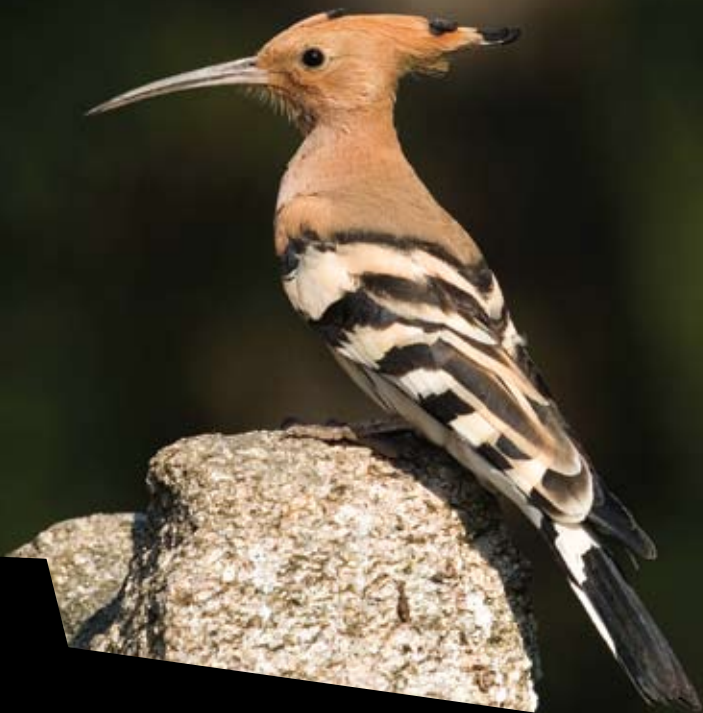
POUPA Upupa epops