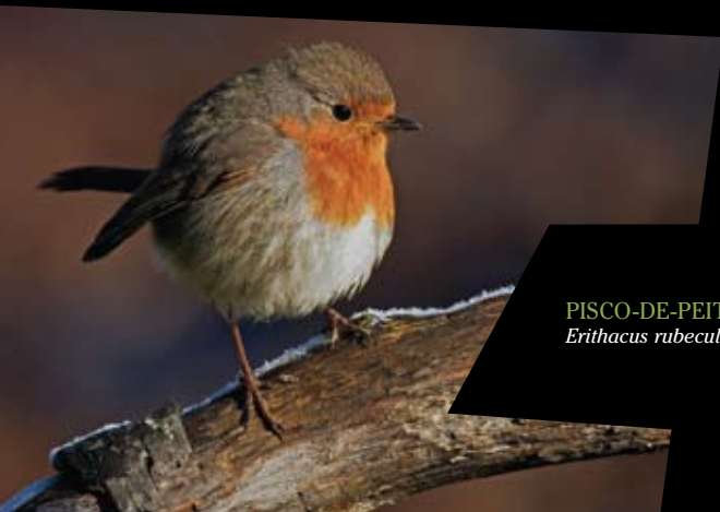
PISCO-DE-PEITO-RUIVO Erithacus rubecula