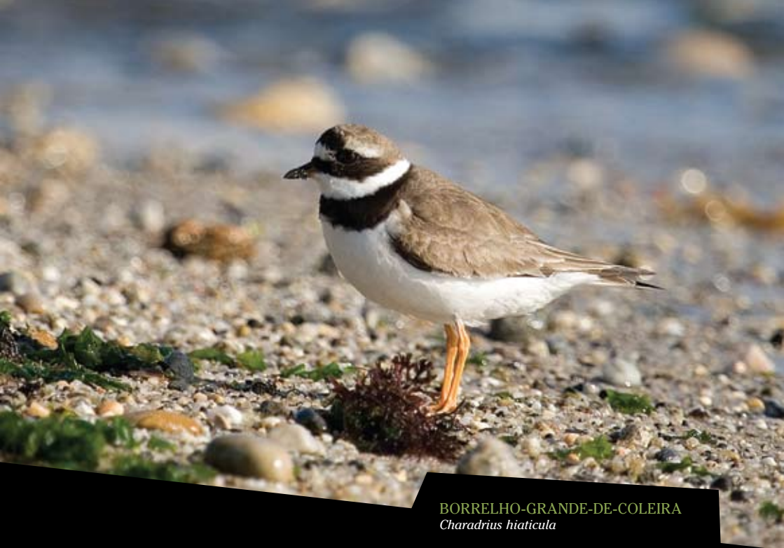
BORRELHO-GRANDE-DE-COLEIRA Charadrius hiaticula