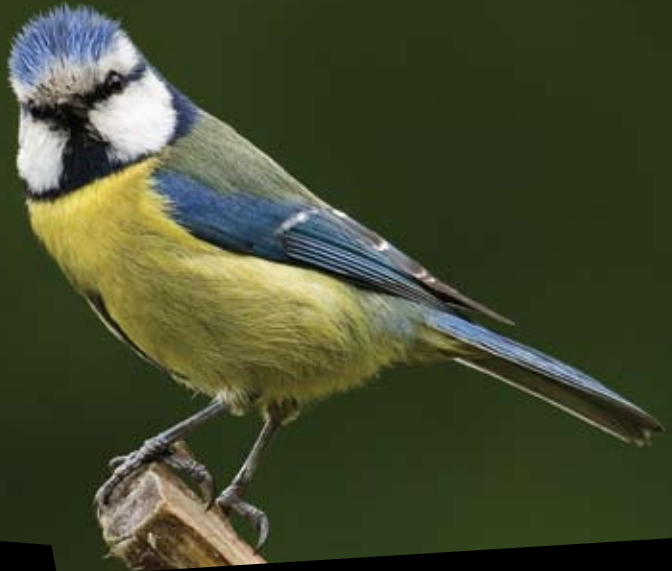
CHAPIM-AZUL Parus caeruleus