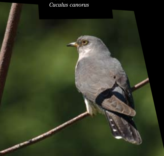
CUCO Cuculus canorus