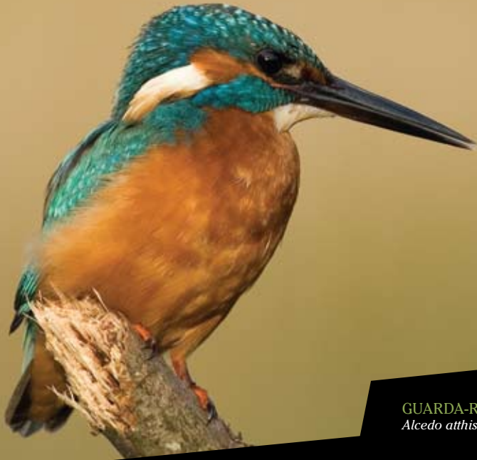
GUARDA-RIOS Alcedo atthis