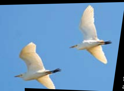
GARÇA-BOIEIRA, CARRACEIRO Bubulcus ibis

Espaço aberto, predominantemente herbáceo, é o local propício à observação da garça-boieira e da garça-real, do pardal-montês, do chasco, da gralha, do peneireiro e da águia-de-asa-redonda mas também do pintarroxo, do bico-de-lacre e das alvéolas, entre outras aves.