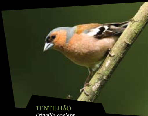
TENTILHÃO Fringilla coelebs

As florestas de carvalhos constituem as formações vegetais autóctones que deveriam cobrir toda a região. No entanto, a longa acção do homem sobre a paisagem levou à sua substituição por campos cultivados e plantações de pinheiro-bravo e eucalipto. Apesar disso, uma parte da veiga de S. Simão (na margem esquerda do rio Lima) e da zona de Cardielos surge como um espaço onde campos agrícolas, pastagens permanentes e espaços florestados com alguma dimensão dão um aspecto distinto à paisagem. É o local propício à observação de espécies de campo aberto, como a perdiz, o faisão, ou de espécies especializadas nas bordaduras, como é o caso do pisco-de-peito-ruivo, da carriça, dos papa-moscas e do mocho-galego. O abibe e a poupa, embora não residentes, são aves muito evidentes pelo seu aspecto inconfundível.