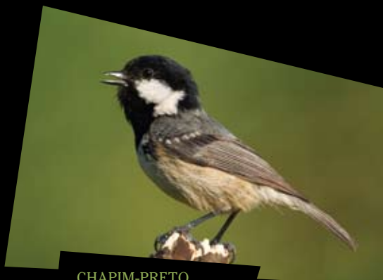
CHAPIM-PRETO, CHAPIM-CARVOEIRO Parus ater