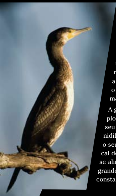
CORVO-MARINHO, CORVO-MARINHO-DE-FACES-BRANCAS Phalacrocorax carbo

A garça-real, a narceja, o pica-peixe e a galinha-de-água são exemplos da avifauna que aqui encontra, pelo menos parcialmente, o seu habitat. Apenas de passagem, a caminho dos seus locais de nidificação mais a norte, a águia-pesqueira faz do estuário do Lima o seu local de pesca e dos bosquetes da veiga de S. Simão o seu local de descanso. Os corvos-marinhos usam também o estuário para se alimentarem e descansar, podendo ser vistos em grupos durante grande parte do Inverno. As inevitáveis gaivotas são também presença constante no estuário.