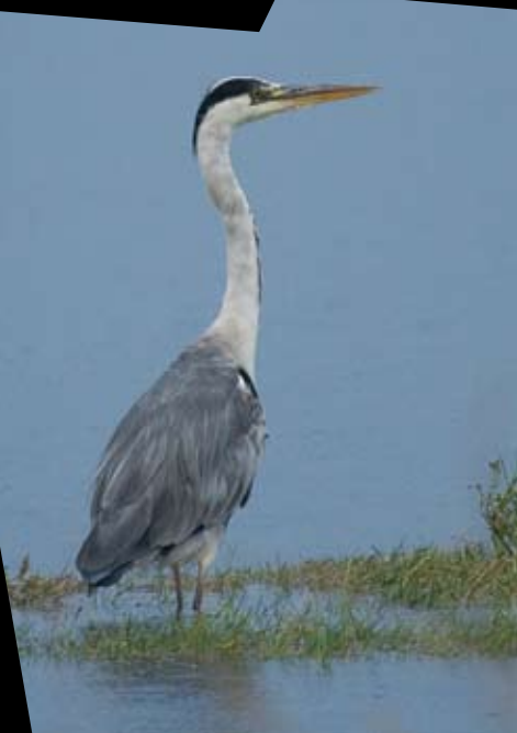
GARÇA-REAL Ardea cinerea