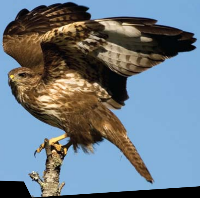
ÁGUIA-D'ASA-REDONDA Buteo buteo