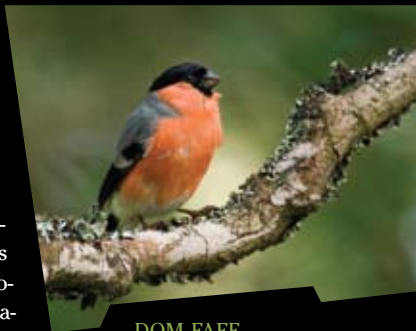
DOM-FAFE Pyrrhula pyrrhula

O pato-real nidifica nas beiras herbáceas que rodeiam as zonas inundadas. A fúinha-dos-juncos, o mergulhão-pequeno, o frango-de-água frequentam os espaços mais fechados, tirando partido do abrigo e alimento que um estrato herbáceo alto lhes proporciona.