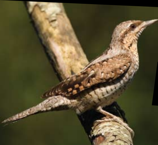
TORCICOLO Jynx torquilla