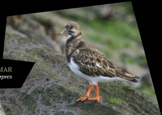
ROLA-DO-MAR Arenaria interpres