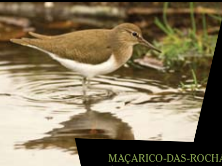
MAÇARICO-DAS-ROCHAS Actitis hypoleucos

As aves limícolas são a principal atracção das dunas e rochedos litorais, no que diz respeito à avifauna. Destacam-se aqui as rolas-do-mar, os pilritos e borrelhos, bem como os maçaricos e a garça branca.