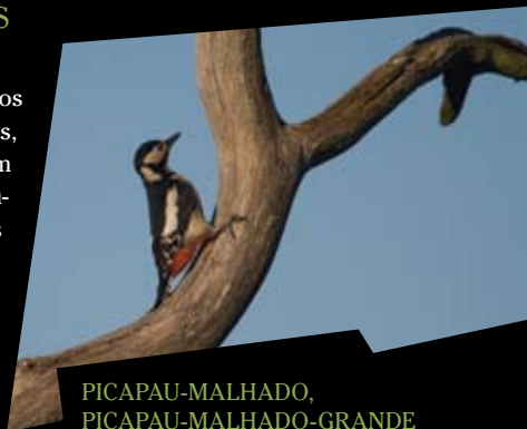
PICAPAU-MALHADO, PICAPAU-MALHADO-GRANDE Dendrocopos major

Os bosquetes em que carvalhos, amieiros e salgueiros são as essências dominantes, mostram um pouco do que seria a paisagem original das margens do rio Lima. Com pouca expressão espacial na zona, os espaços arborizados albergam, apesar disso, uma fauna variada, nomeadamente espécies mais ligadas a ambientes florestais, como é o caso dos chapins, das estrelinhas, das felosas, do gaio, das rolas, pombos, dos pica-paus e do cuco.