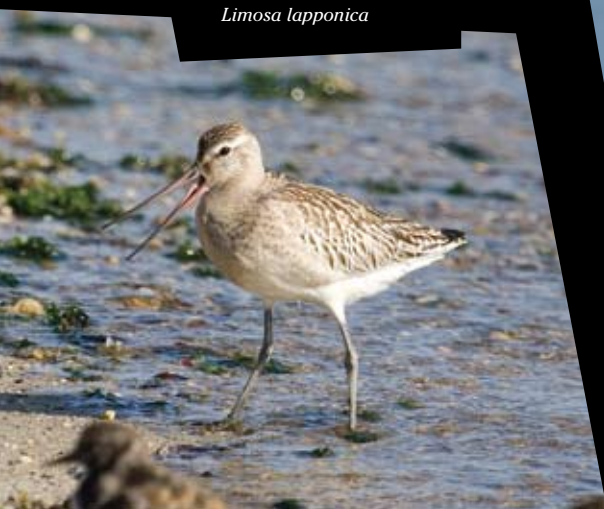
FUSELO Limosa lapponica