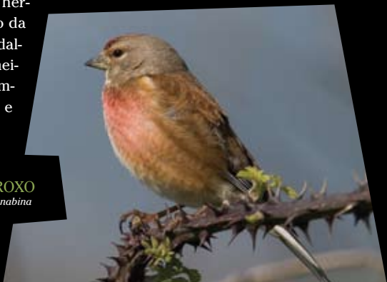
PINTARROXO Carduelis cannabina