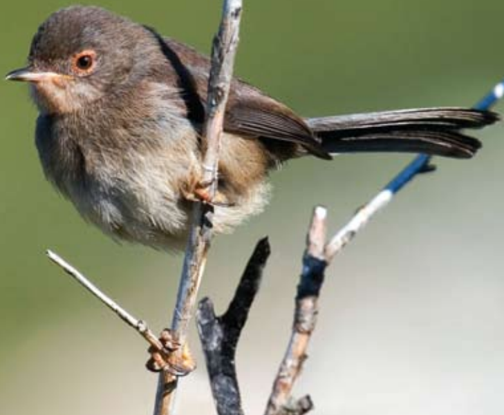
TOUTINEGRA-DO-MATO, FELOSA-DO-MATO Sylvia undata