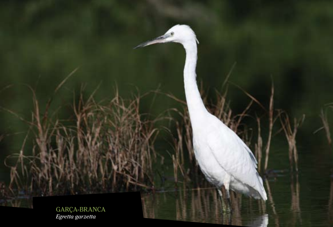
GARÇA-BRANCA Egretta garzetta