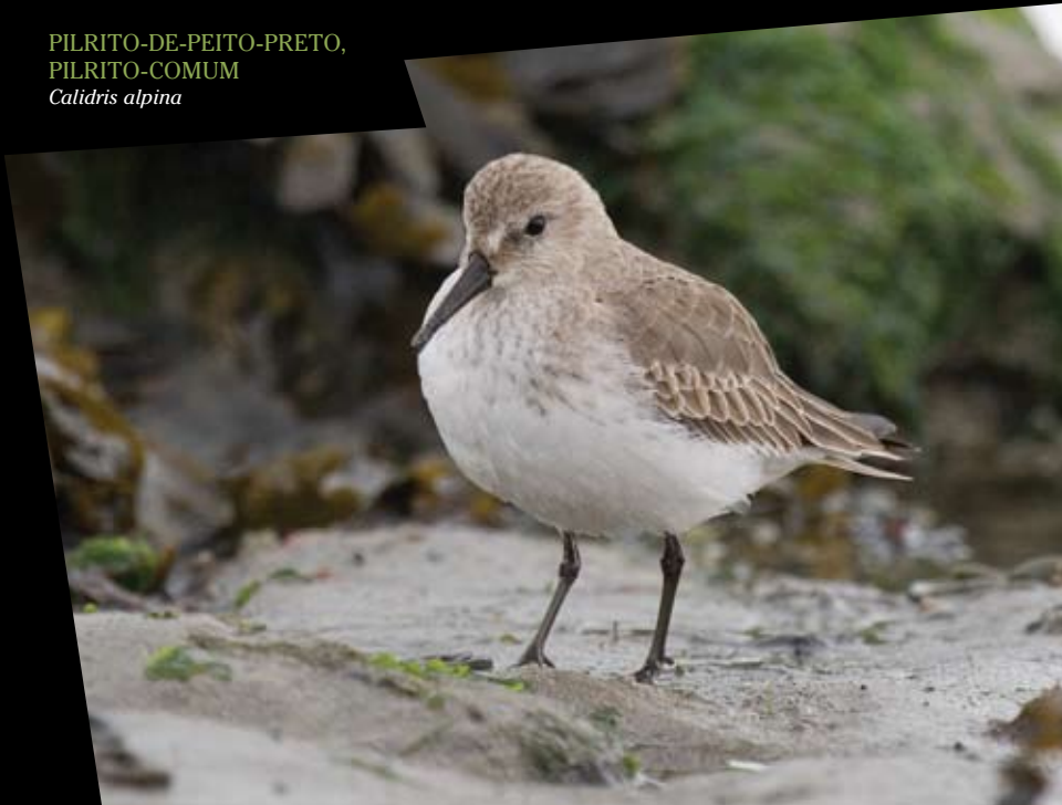
PILRITO-DE-PEITO-PRETO, PILRITO-COMUM Calidris alpina