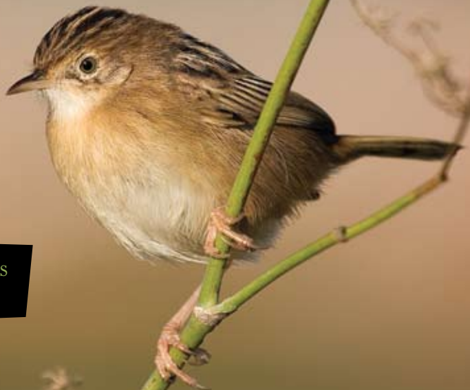
FUINHA-DOS-JUNCOS Cisticola juncidis