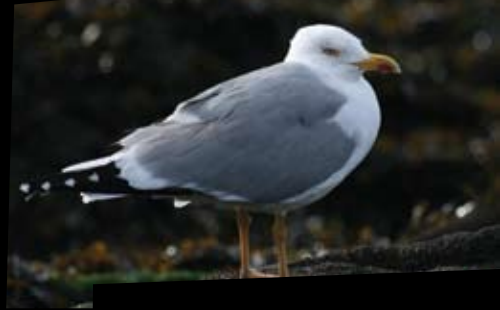
GAIVOTA-DE-PATAS-AMARELAS Larus cachinnans

Os rochedos litorais constituem a característica paisagística mais marcante da faixa litoral a norte de Viana do Castelo. A natureza granítica da região de Afife, dá lugar a xistos grafitosos a partir de Carreço. Espaço estreito durante a maré alta, a sua dimensão só se aprecia completamente quando as águas recuam, descobrindo uma plataforma que em alguns casos alcança os 200m de largura. Este espaço rochoso, no entanto, constitui apenas uma pequena amostra da riqueza biológica existente nos rochedos adjacentes, permanentemente submersos.