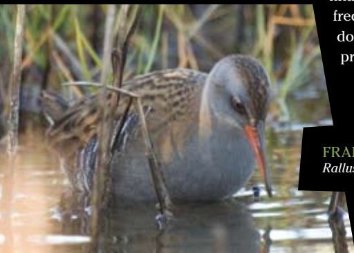
FRANGO-D'ÁGUA Rallus aquaticus