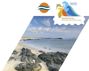
PRAIA DE CANTO MARINHO