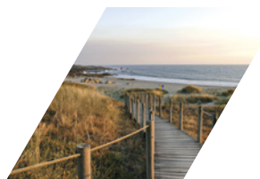
PRAIA DE FORNELOS E PROMONTÓRIO DE MONTEDOR