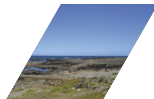
PRAIA DO PORTO DE VINHA