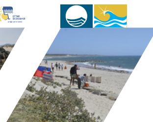
PRAIA DE CASTELO DO NEIVA