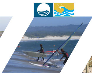
PRAIA DO CABEDELÓ