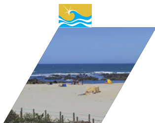
PRAIA DA ÍNSUA