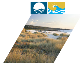
PRAIA DE PAÇÔ