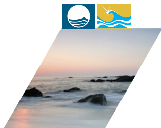
PRAIA DE AFIFE