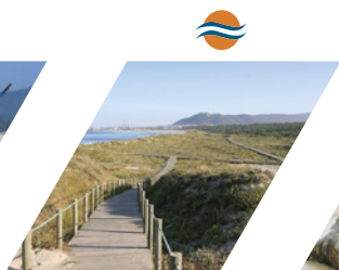
PRAIA DO RODANHO