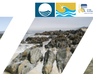
PRAIA DA AMOROSA