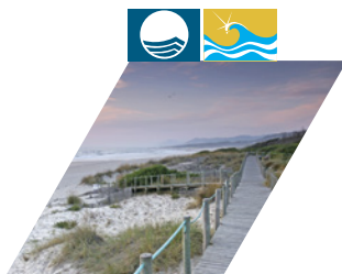
PRAIA DA ARDA | BICO